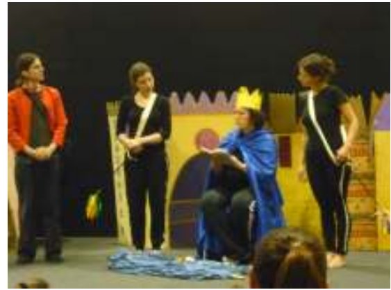
Alcuni momenti della serata

Nella serata del 24 giugno, nell'ambito della rassegna cinematografica "Cinema Amore Mio", il Centro per l'Affido ha proposto la visione della pellicola "Stella" della regista francese Sylvie Verheyde, per approfondire come un progetto di affido possa essere di supporto ad una famiglia in difficoltà.